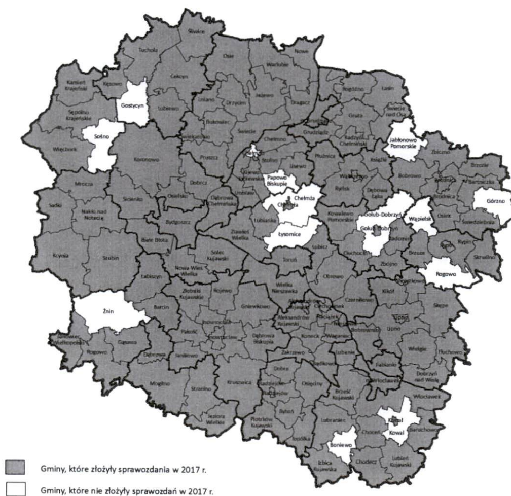
Rys. 1 Gminy województwa kujawsko-pomorskiego, które w 2017 roku nie złożyły sprawozdania za 2016 rok

W 2017r. na 144 gminy województwa kujawsko-pomorskiego sprawozdanie z realizacji Gminnych Programów Przeciwdziałania Narkomanii w 2016 r. złożyło tylko 130 gmin (ze względu na obowiązujące okresy sprawozdawcze poniższe dane dotyczą 2016 roku).