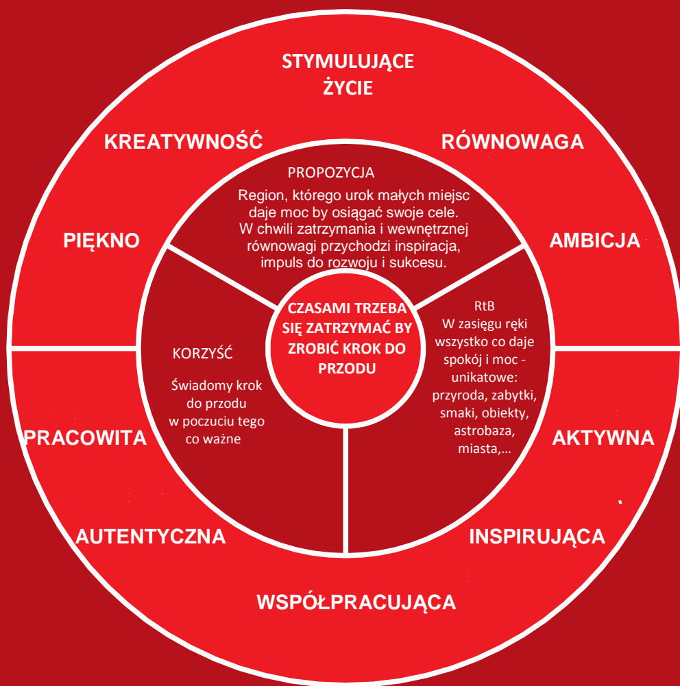
Rysunek 2. Wartości i osobowość, propozycja, korzyści i uzasadnienie marki województwa kujawsko-pomorskiego – podsumowanie