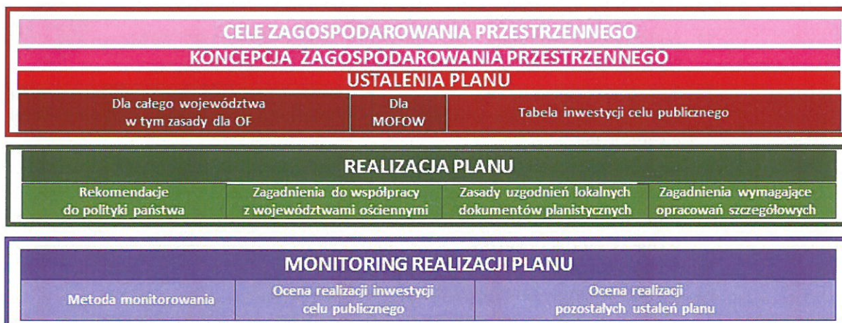
Rysunek 2 Schemat części projektowej planu zagospodarowania przestrzennego województwa kujawsko-pomorskiego

Powyższe prace pozwoliły na ukończenie etapu diagnostycznego i przejście do etapu sporządzenia projektu Planu, który zgodnie z przygotowanym wcześniej schematem składać się będzie ze wskazanych niżej elementów: