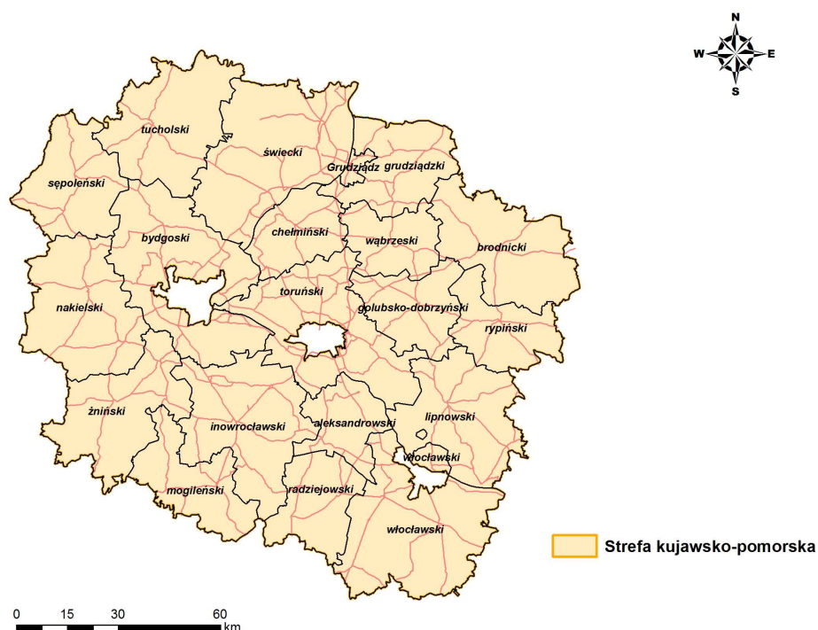
Rysunek 1 Strefa kujawsko-pomorska

Strefa kujawsko-pomorska położona jest w północno-środkowej części kraju. Obejmuje obszar o powierzchni ok. 17 596 km 2 . Według danych GUS z 2015 roku w strefie mieszkało 1,4 mln mieszkańców. W strefie znajduje się 49 miast. Strefa kujawsko-pomorska graniczy z województwami: pomorskim, warmińsko-mazurskim, łódzkim i wielkopolskim.