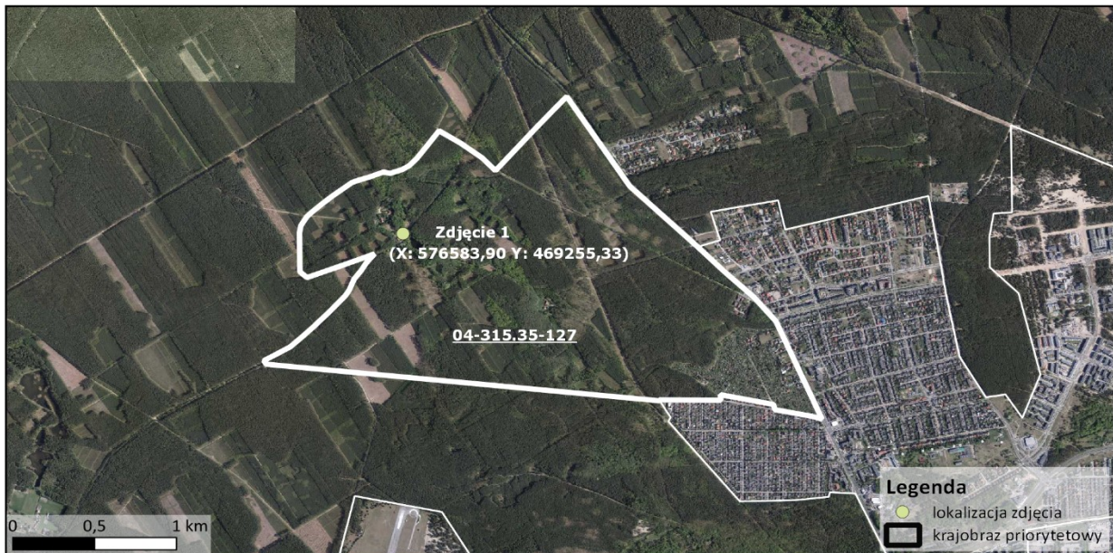
Mapa 1. Krajobraz priorytetowy 04-315.35-127

Źródło: Opracowanie własne - Kujawsko-Pomorskie Biuro Planowania Przestrzennego i Regionalnego we Włocławku na podstawie ortofotomapy