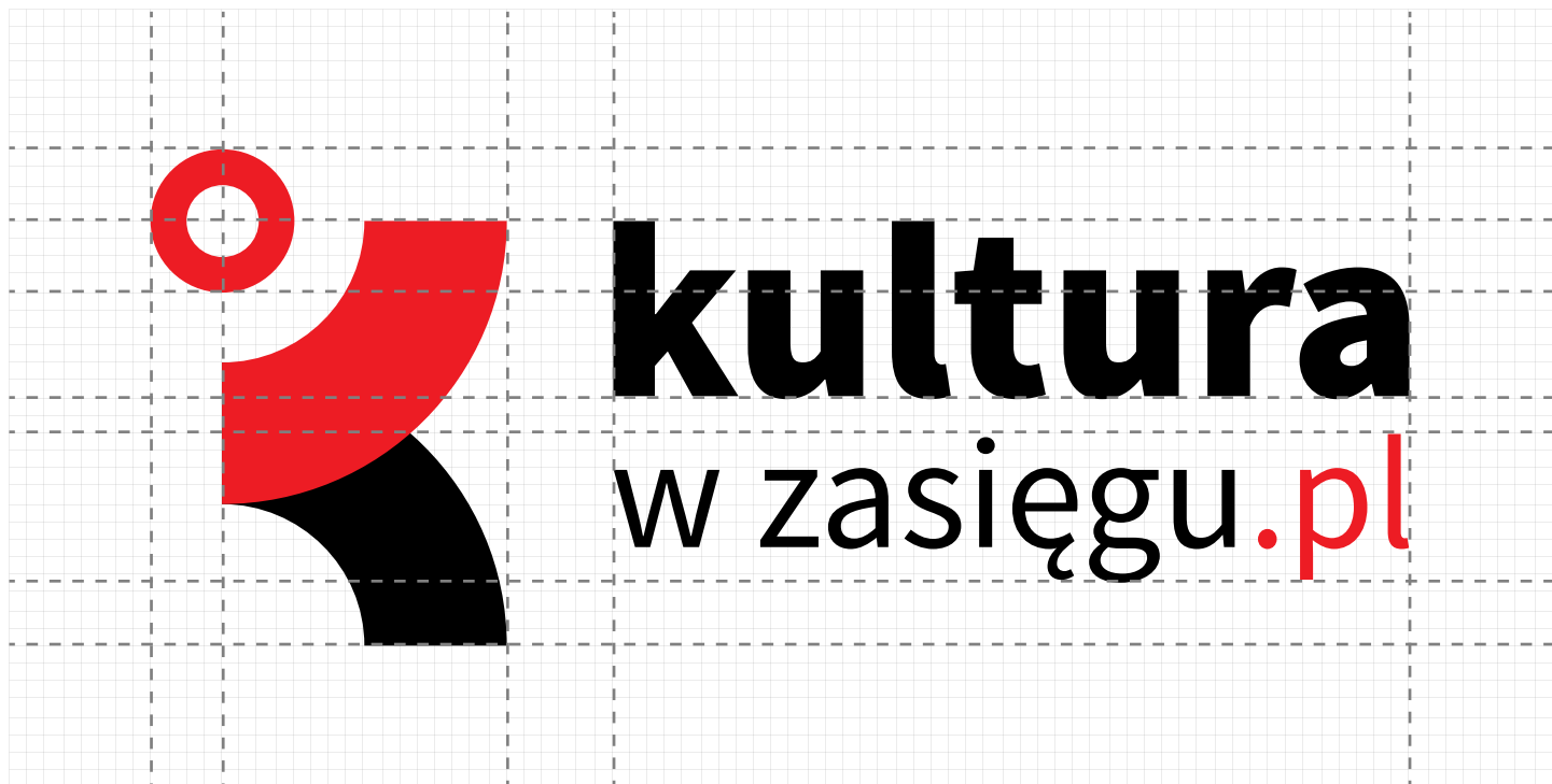
KONSTRUKCJA ZNAKU W UKŁADZIE POZIOMYM