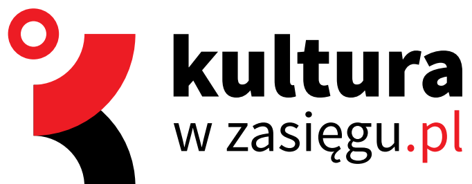
UKŁAD POZIOMY ZNAKU