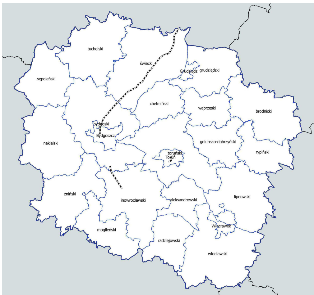
Rys. 2.2. Przebieg analizowanych odcinków linii kolejowych w województwie kujawsko-pomorskim o natężeniu ruchu ponad 30 000 pociągów rocznie